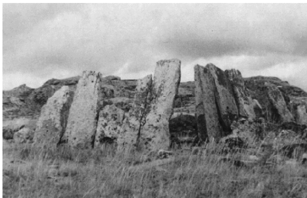
Рисунок 1 – Бегазы-дандыбаевская культура